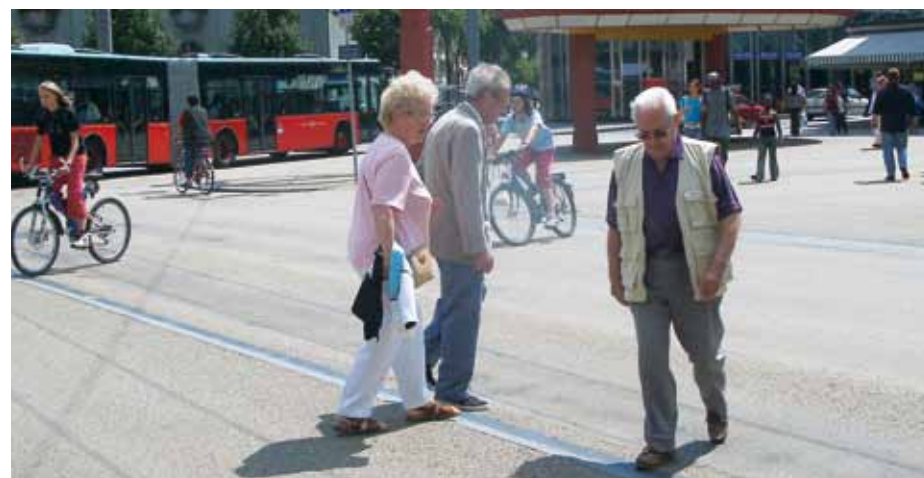
Bienne, place Centrale. Un «cas avant-gardiste» où l'on a dû intégrer l'exigence des bordures biaisées permettant d'identifier la zone de circulation. Mais l'effet de séparation a pu être atténué par le revêtement coloré qui donne son unité à la place.