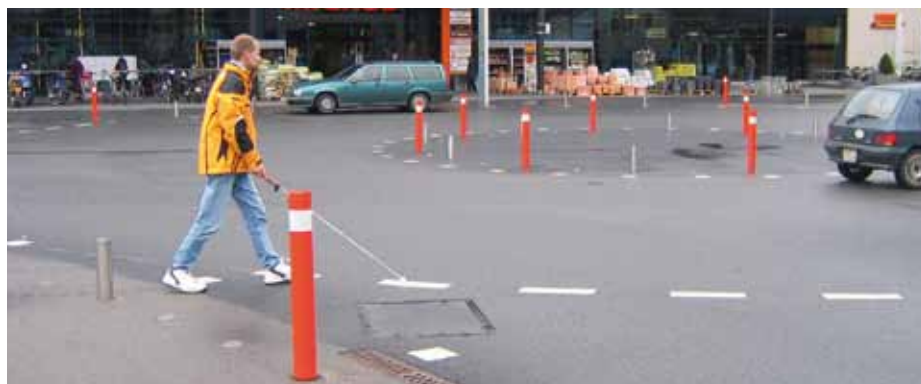
Köniz, Bläuackerplatz. En dépit d'un bilan sécuritaire particulièrement bon, certains aménagements de la zone 30 en font un «cas conflictuel» pour les malvoyants. Des bordures seront réintroduites au niveau du giratoire avec l'arrivée du tram.

Comment par exemple concilier valorisation du patrimoine d'un revêtement pavé et confort des usagers, concept architectural inhabituel et usage au quotidien, desserte bus et zone de rencontre, prescriptions de détail et vision globale?