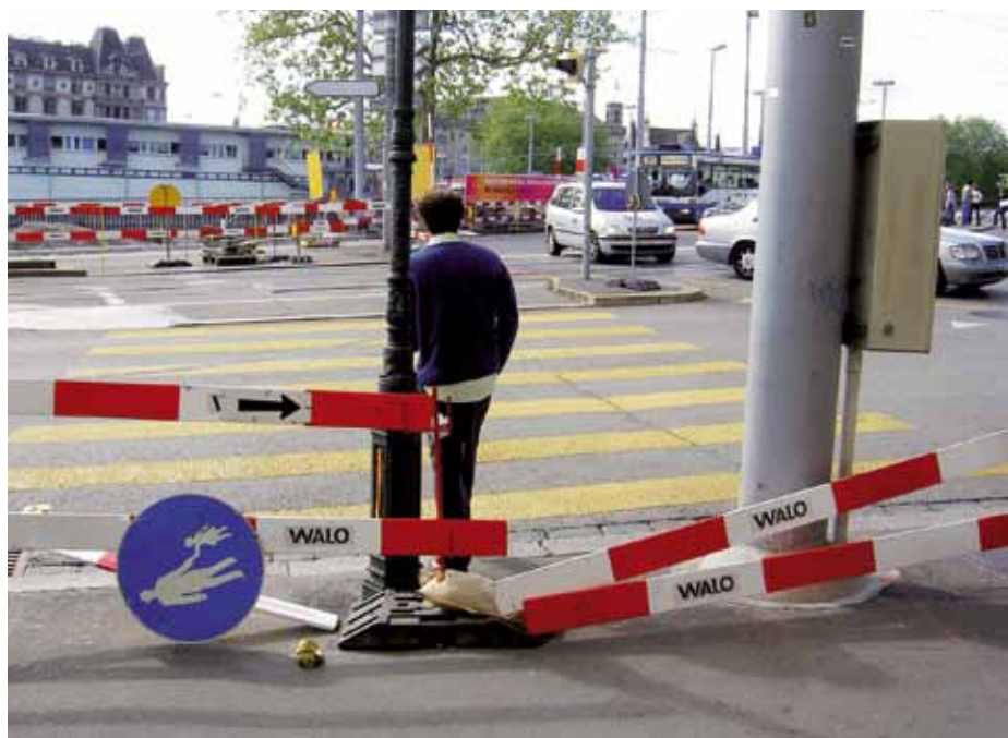
Un exemple courant. L'usager accepte mal des mesures de remplacement peu pratiques – en particulier les week-ends, quand le chantier n'est pas actif.

Assurer la sécurité des piétons et éviter les détours constituent des tâches prioritaires. Les piétons ne tolèrent généralement pas un facteur de détour supérieur à 1,2 (5 à 10m pour des tronçons courts) d'après la norme VSS 640 070 Trafic piétonnier - norme de base. En cas de détour trop important, ils ignorent le balisage et s'exposent aux dangers du trafic ou du chantier. Lors de chantiers, on a bien souvent tendance à préserver la chaussée de tout rétrécissement, au détriment des espaces piétons. Des solutions de compromis, avec empiète-