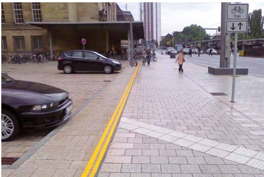
Leipzig (D). Intégrer les usagers en amont du processus aurait permis d'éviter la mise en place de la bande jaune pour signaler la bordure.

Récompensé par une mention du Flâneur d'Or 2011, le projet du Glattalbahn fait figure d'exemple en la matière. Inaugurée en décembre 2010, cette nouvelle ligne de tram connecte le Nord de la couronne de l'agglomération zurichoise à un total de 21 arrêts. Plutôt que de subir les prescriptions de la Loi sur l'élimination des inégalités frappant les personnes handicapées (LHand) comme une contrainte, la Direction