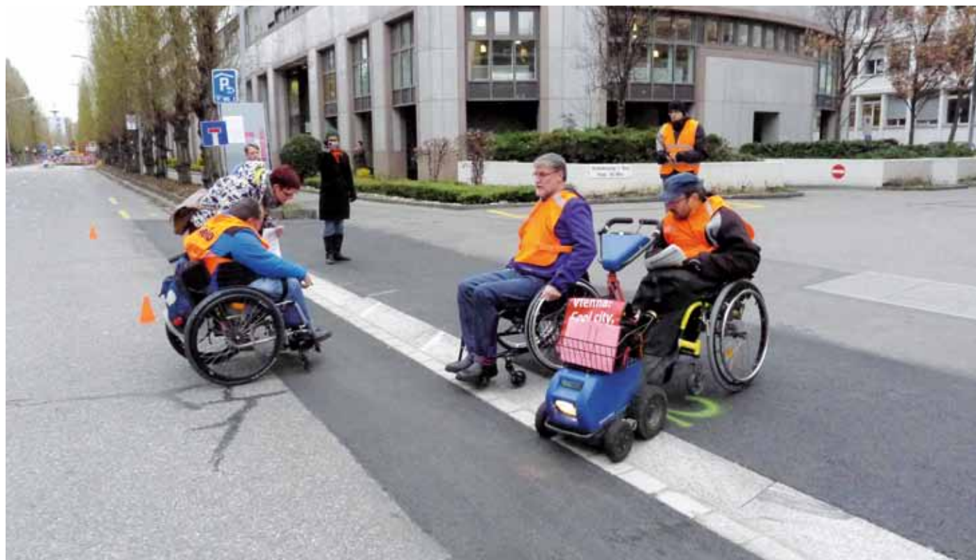
«Laboratoire des bordures». Des usagers en chaise roulante testent différentes variantes de bordure de trottoir en grandeur nature.