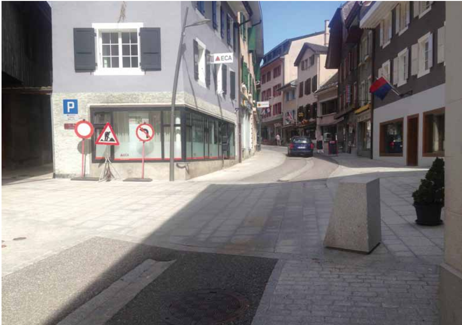
Château d'Oex, Grand-Rue: Pas toujours facile de définir si un espace est mixte ou partagé: dans cet aménagement en zone 30, sans seuil, une certaine séparation des flux est maintenue par le biais de revêtements différenciés qui suggèrent un espace de circulation réservé aux véhicules et des trottoirs pour les piétons. Le contraste de matériaux et leur différence de texture facilitent le repérage pour les personnes malvoyantes et aveugles.

risque fort de poser des problèmes de mise en œuvre et de proportionnalité, comme le soulignaient plusieurs intervenants.