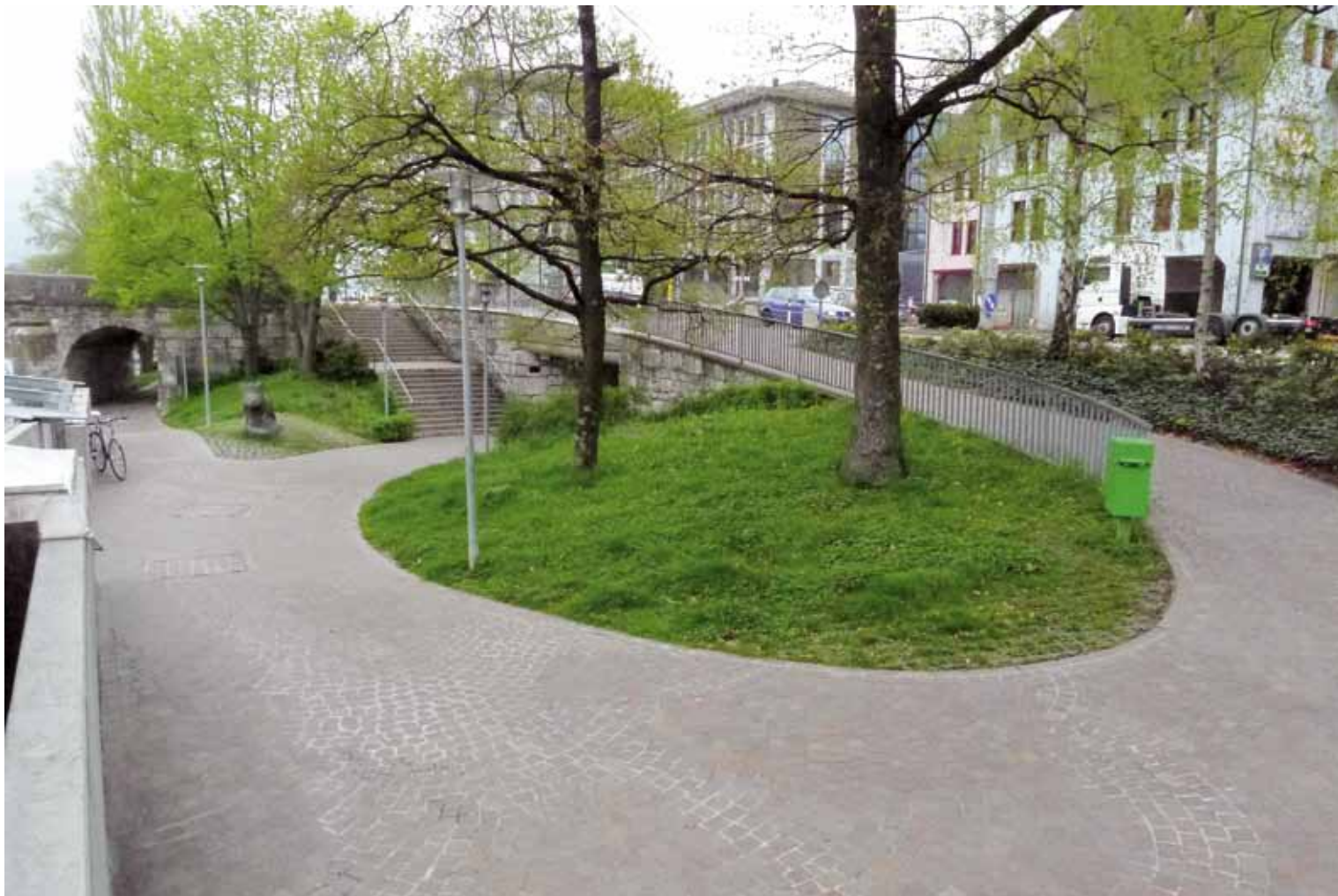
Olten. Aménagement exemplaire sur les berges de l'Aar: le choix est donné entre deux itinéraires, rampe peu pentue ou escalier direct, pour relier le passage sous le pont.

Aménager l'espace-rue sans qu'il constitue un obstacle pour les usagers est en soi un objectif indiscutable. Il en va de la liberté de mouvement de chacun. La journée d'étude soulignait la diversité des besoins pour se déplacer de manière autonome en fonction des différents profils d'usagers. Une pluralité à considérer en amont des réflexions sur l'espace public.