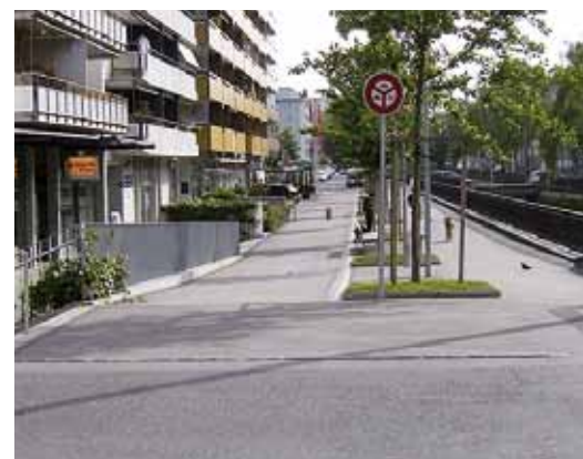
Bienne, Quai du Haut. Un «cas limite», où la ségrégation entre piétons et cycles, réintroduite pour améliorer la sécurité, induit au final moins d'attention vis-à-vis des piétons et une perte globale de convivialité.

Pour garantir l'accessibilité pour tous, le projet de norme (voir p. 3) prévoit des critères pour choisir entre mixité ou ségrégation de l'espace. Trancher la question est pourtant loin d'être simple. Des critères très restrictifs tendent à donner la priorité aux exigences des PMR au détriment d'autres considérations. Des réalisations récentes considérées comme exemplaires, élaborées avec le concours des associations, ne seraient ainsi pas envisageables dans le cadre d'une application stricte de la norme.