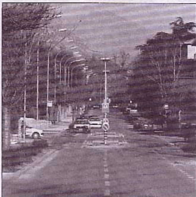
Exemple de modération du trafic à Sion.