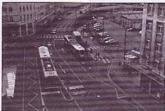
Accessibilité aux TC. Interface à améliorer (place Bel-Air).