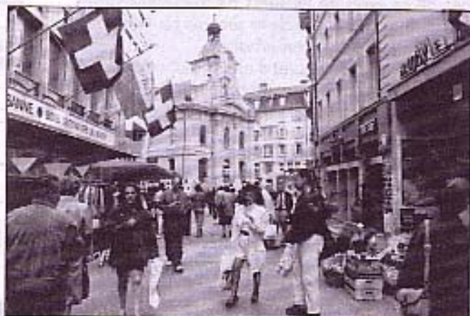
L'espace public, un enjeu social. Zone piétonne à aménager (rue St-Laurent).

L'espace urbain doit favoriser tous les usages: promenades, achats, activités, rencontres, jeux, délasserment, circulation. Sa voca-