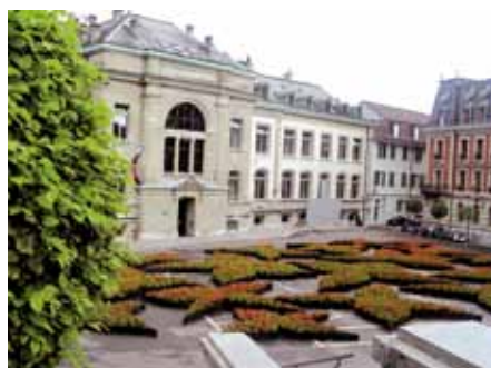
Les Lausannois ont pu profiter pendant quatre mois d'une place du Château libérée du stationnement.

Des occupations plus longues sont envisageables et sont souvent bien acceptées par la population lorsqu'elles amènent une réelle plus-value à l'espace public. Ce fut le cas en 2009 où, dans le cadre de Lausanne Jardins, les habitants de la Cité découvraient une place du Château libérée de son parking.