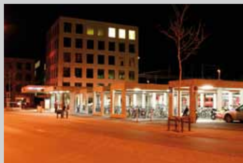
A Coire, le stationnement à l'arrière des quais s'accorde particulièrement bien à la haute école construite dans le sillage du remaniement de la gare. Le soin particulier prêté à l'éclairage nocturne ajoute au sentiment de sécurité aux abords de la gare.

En gare de Coire, une offre pour les cyclistes venant de n'importe quel quartier de la ville est proposée dans des standings différents. Une vélostation payante offre des places vidéo-surveillées de chaque côté des rails. D'importants parcs couverts en libre accès sont situés sur le trajet le plus direct entre le bord de la route et les quais. Sur la place centrale, des unités de stationnement non couvertes proches des commerces offrent une alternative pour des dépôts moins longs. Ainsi, les cyclistes trouvent une solution appropriée à presque tous leurs besoins, au même titre que les automobilistes.