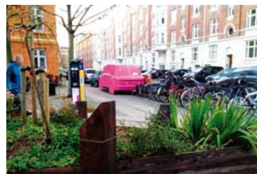
A Copenhague, cette voiture rose est en mesure d'abriter 4 vélos cargo. On estime à 15'000 leur nombre dans la ville.

Hors du cadre événementiel ou saisonnier, l'innovation est moins facile à trouver. La place de stationnement réinventée fait le plus souvent partie d'un concept plus large (c'est le cas du Stadtlounge de St-Gall illustré en couverture) ou alors elle répond en réalité à un autre besoin, comme ces locaux de rangement de «vélos cargo» à Copenhague.