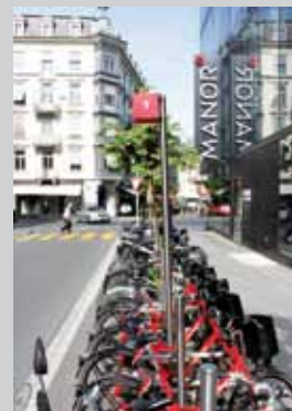
A Bienne, la Ville a opté pour un type de stationnement modulaire utilisé de façon uniforme dans tout le centre-ville, et a même développé un système de bikesharing qui s'y intègre.