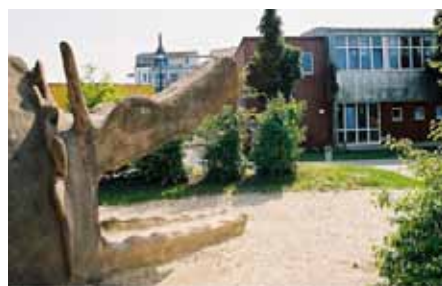
Le quartier Rieselheld, également à Freiburg-im-Brisgau. Les aires de jeux sont ouvertes sur la rue. Plus besoin de clôturer l'espace de loisirs des enfants.