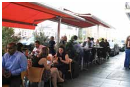
Profiter des bords du Rhône assis autour d'un verre plutôt qu'au volant de sa voiture? C'est possible, mais seulement du 1 er mars au 31 octobre pour les terrasses sur places de parc.

On trouve une réappropriation, certes plus classique, mais également plus pérenne à Genève, où de nombreuses places sont transformées en terrasse le temps des «beaux» jours. Le gain en termes de convivialité est indéniable et la Ville de Genève affiche son soutien à cette pratique par le biais du «concours de la plus belle terrasse».