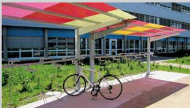
Le quartier de l'innovation à l'EPFL: un exemple de stationnement vélos couvert «customisé» fait à partir d'une structure classique: la couverture est faite de scobalite coloré éclairé par des LED dont l'intensité varie en fonction de la force du vent.