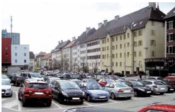
Une place de stationnement, c'est au moins 10 m 2 de terrain. Dans la plupart des ménages, les voitures sont immobiles 95% du temps. Lorsque le stationnement s'effectue sur la voie publique, il peut être assimilé à une confiscation d'un bien public destiné à tous.