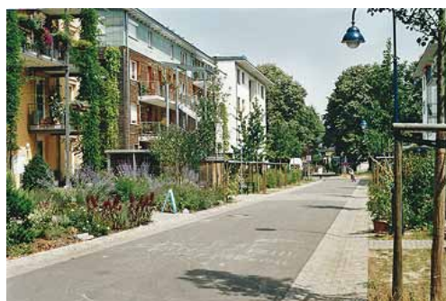
Dans l'éco-quartier de Vauban à Fribourg-en-Brisgau, seuls des arrêts de courte durée sont autorisés sur l'espace public. Le stationnement a lieu dans un parking en silo. Les rues sont ainsi rendues aux enfants, aux piétons et aux cyclistes.