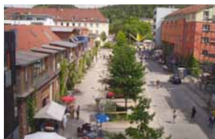
Une rue du «Quartier Français» à Tübingen. On peut imaginer des rues larges et linéaires sans pour autant qu'elles soient accaparées par le stationnement ou le trafic routier. Les quelques voitures ici semblent moins à leur place que les parasols des terrasses.