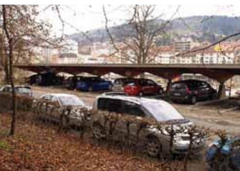
La Chaux-de-Fonds, 3ème ville de Suisse romande, n'a pas encore mis en place de politique de stationnement. L'offre publique sur voirie, abondante, gratuite et, sauf dans l'hyper-centre, à durée illimitée, n'y est pas sans incidence: ici elle empiète sur la moitié d'un étroit trottoir et concurrence un P+R géré par les CFF. Elle nuit aussi à l'utilisation des transports publics urbains.