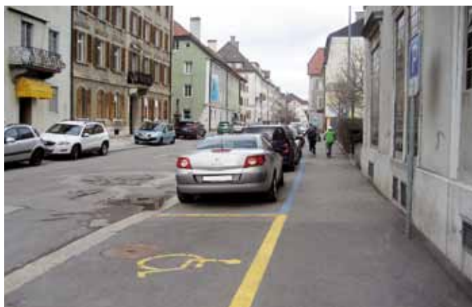
L'habitude de voir les voitures occuper l'espace public finit par amener à penser que cette situation est « normale » et inéluctable. Pourtant, même généralisée, elle est contraire à la ville durable: ville pour tous, partagée équitablement entre tous ses usagers.

Les besoins en stationnement diffèrent selon les usages (courte-moyenne durée de jour pour les activités économiques; longue durée de jour et de nuit pour l'habitat; longue durée de jour pour le travail) et nécessitent des mesures différenciées. C'est pourquoi les villes distinguent généralement au moins deux périmètres: le centre-ville et les quar-