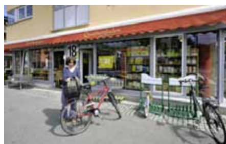
Vauban, devant l'épicerie de quartier: des caddies, des bancs, et des racks à vélos, mais pas de places de stationnement voitures. En Suisse, malgré le nombre important de petits supermarchés urbains, il est encore rare de trouver du mobilier urbain installé par les enseignes.

www.groupechronos.org/fre/blog/l-ecoquartier-et-ses-mobilites-introduction