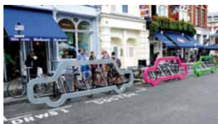
1 voiture pour 10 vélos. Le projet réalisé par le bureau londonien Cyclehoop dans le cadre du London Festival of Architecture en 2010 illustre en toute simplicité ce ratio et l'un des intérêts de la petite reine en milieu urbain: son emprise restreinte sur l'espace public.

En Suisse, le nombre de places de stationnement vélos sur domaine public est nettement plus bas que le nombre de places automobiles, alors même que les taux d'équipement des ménages sont comparables (70% des ménages suisses ont au moins un vélo, 80% au moins une voiture). Pourtant, contrairement au stationnement automobile, le stationnement vélo est un type de stationnement dans l'air du temps et qui gagne à être développé, dans une optique de promotion des modes doux. Le confort apporté par des stationnements de qualité et bien placés encourage l'utilisation du vélo, le rend plus visible et montre qu'il est bienvenu en ville. De plus, les bicyclettes ont un avantage non négligeable par rapport au stationnement automobile: elles sont bien plus économes en espace et en deniers publics.