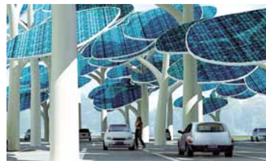
Solar Forest: Les places de stationnement sont équipées de panneaux solaires qui permettent d'alimenter les voitures électriques. Quel avantage pour l'espace public? Les panneaux solaires permettent de garder les voitures à l'ombre!

Enfin, on ne le rappellera jamais assez, même une voiture potentiellement «verte» consommera de l'espace. La preuve par l'absurde nous vient de l'insolite projet «Solar Forest», présenté à la journée du développement durable de Pékin en 2009.