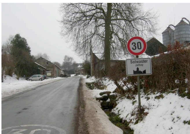
Solwaster, agglomération à 30 km/h.

La réglementation belge permet également la création d'une agglomération à 30 km/h. Il suffit pour cela d'associer le signal annonçant le début d'agglomération à un signal « 30 km/h ». Le village de Solwaster (région spadoise) est jusqu'à présent la seule localité ayant fait usage de cette possibilité. A signaler toutefois : dans son état actuel, la réglementation exclut de maintenir des voiries à 50 km/h dans une agglomération à 30 km/h 12 .