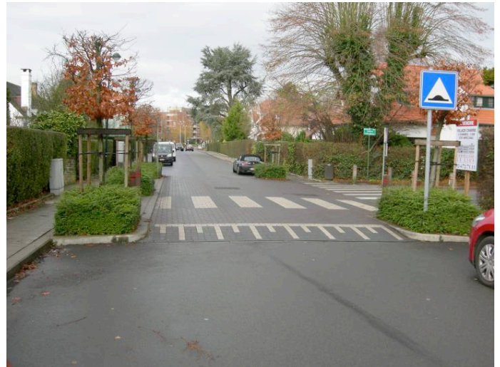
Intervention classique en carrefour : surélévation et rétrécissement de l'espace par des plantations.

La conception des interventions visant à induire des vitesses basses est en évolution constante. Les obstacles physiques – tels que dispositifs surélevés et dévoiement notamment – sont bien sûr efficaces, mais d'autres types d'interventions peuvent induire des vitesses réduites. En général, les interventions en carrefour – où le ralentissement est naturel – sont à privilégier et ne doivent être complétées par des aménagements en section que si cela s'avère nécessaire du fait de la longueur et/ou largeur du tronçon. Dans tous les cas, il s'agit essentiellement de réduire l'emprise de l'espace circulaire et, de manière plus générale, de redimensionner à la baisse l'espace perçu.