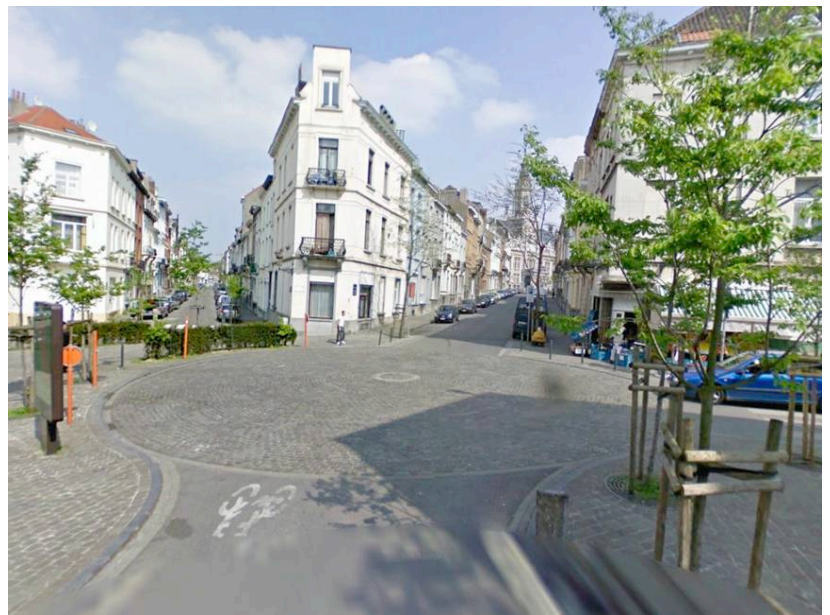
Réaménagement de carrefour avec fermeture partielle et rupture visuelle de la continuité de l'espace de circulation.

En carrefour, on peut notamment jouer sur la réduction des rayons de courbure au bénéfice de l'espace piéton et des diverses activités riveraines susceptibles de déborder sur la voie publique ou opter pour un mini-giratoire dont l'îlot central peut être plus ou moins franchissable pour tenir compte des besoins des poids lourds et des véhicules de secours. Ce même principe de contingentement de l'espace de circulation peut également s'appliquer en section, de manière purement visuelle (par l'emploi de matériaux de revêtement différents) ou, plus radicalement, en revoyant le profil de la voirie. Le rétrécissement peut-être ponctuel ou plus étendu. Un autre type d'intervention possible consiste à briser la linéarité de la chaussée et réduire la longueur des perspectives, par exemple en créant des ruptures d'axe, ou en introduisant des éléments verticaux (plantations, ...).