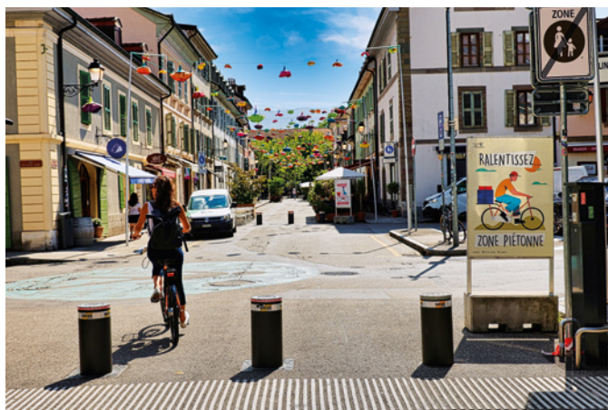
RUE ST-JOSEPH des panneaux et marquages au sol aident à favoriser la cohabitation.

Tout changement dans l'espace public demande un ajustement, un nouveau parcours, une nouvelle habitude à prendre, par exemple en termes de déplacements, et peut susciter enthousiasme des uns et scepticisme, voire crainte des autres. Il s'agit d'accompagner ces évolutions en prenant en compte ces différents ressentis. Dans ce sens, une communication claire est un élément clé. Pour permettre aux riverain·e·s et usager·ère·s de profiter au mieux des nouvelles offres proposées par les aménagements, la ville de Carouge s'efforce d'informer en amont, autant que possible, des changements à venir, avec une attention