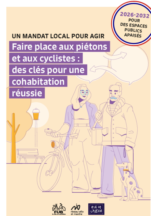
Plaidoyer cohabitation piétons et cyclistes