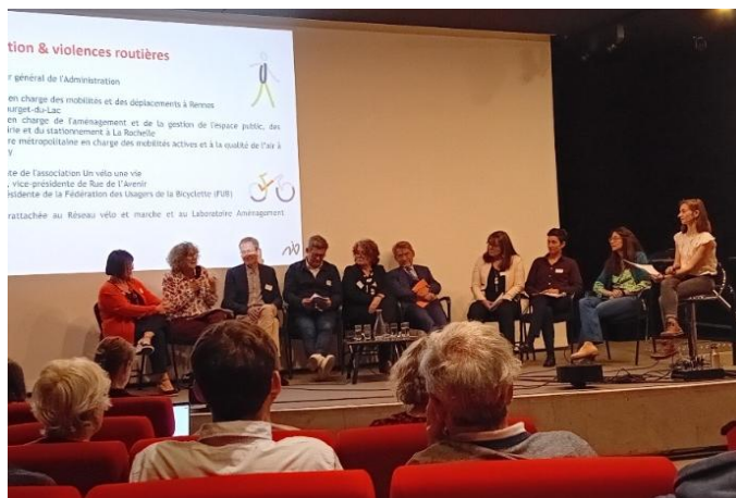
Table-ronde cohabitation et violences routières Réseau vélo et marche avril 2025

Brochure-compte-rendu des journées d'étude et visites apprenantes à Avignon – mai 2025