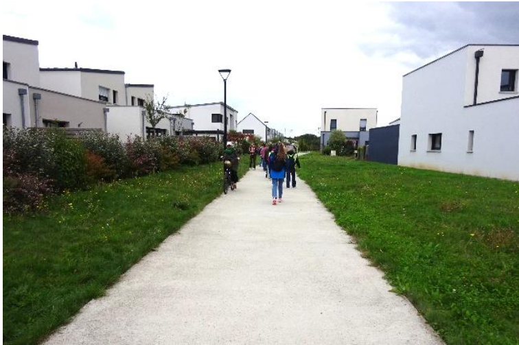
Visite apprenante à Acigné (35)