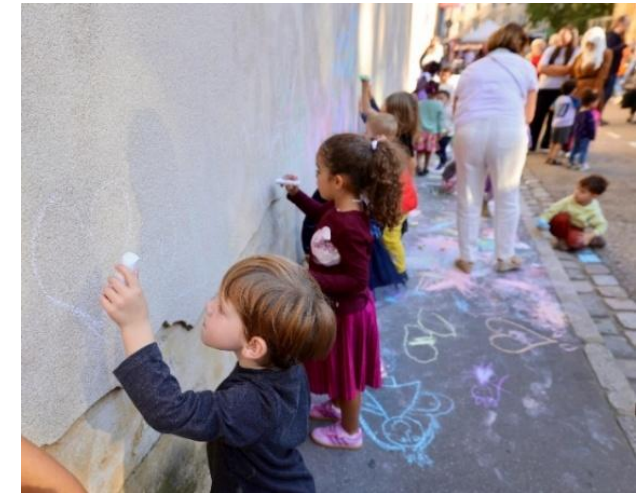
Rue aux enfants – Metz (57)