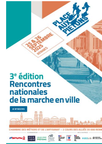
Restitution des Rencontres 2025 de la Marche en ville