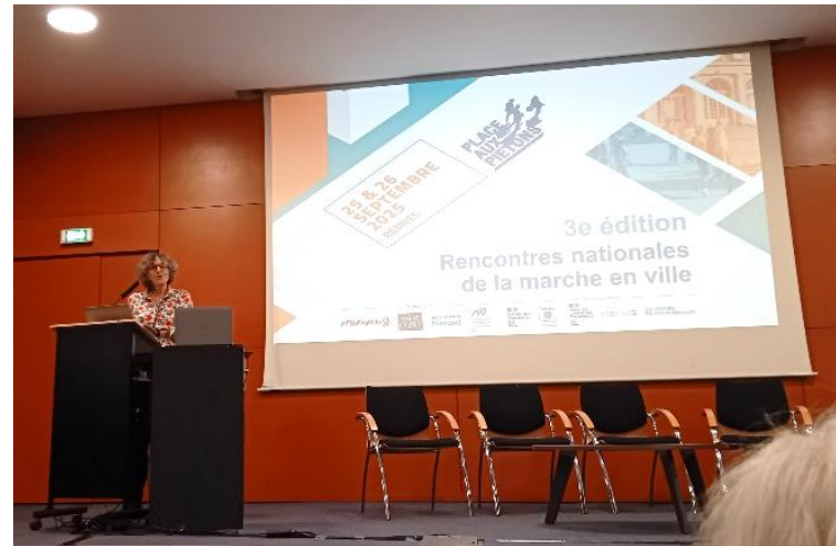
3 ème Rencontres nationales 2025 de la Marche en ville