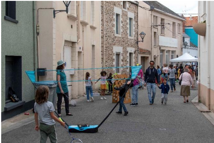
Rue aux Enfants – Indre (44)