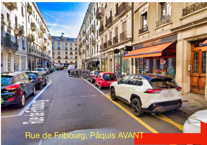
Rue de Fribourg, Pâquis AVANT