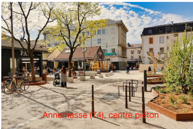
Annemasse (74), centre piston