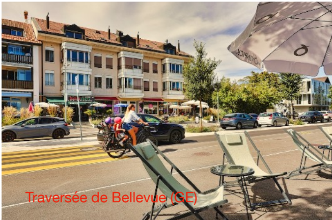
Traversée de Bellevue (GE)