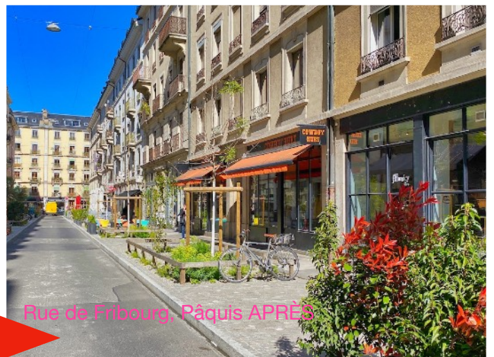
Rue de Fribourg, Pâquis APRÈS