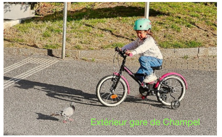
Extérieur gare de Champel