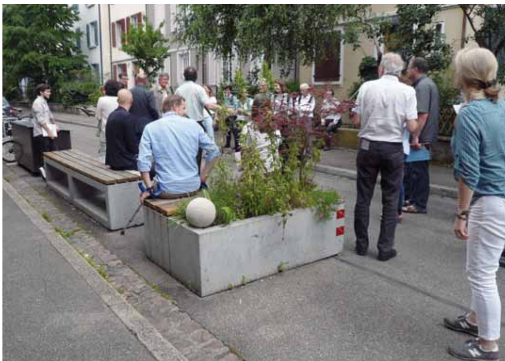
Les aménagements dans les zones de rencontre sont simples (en partie standardisés) et à l'usage des habitants.

www.ca-marche.ch/projet/environnements-sante