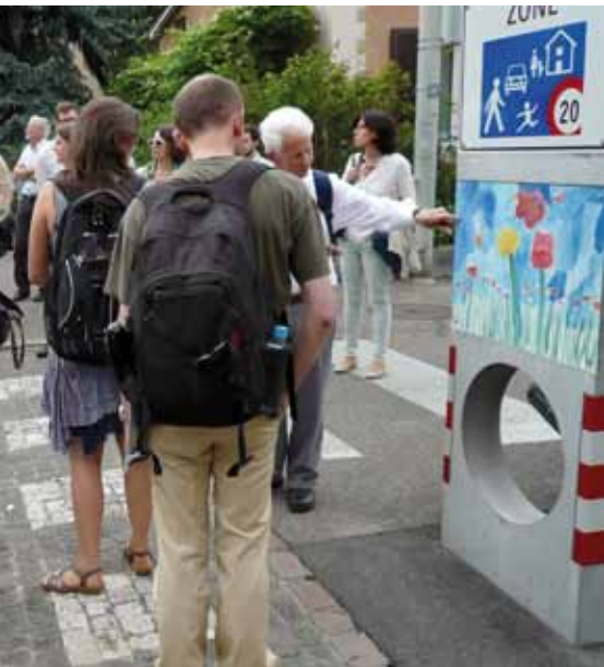
Walkshop à Bâle. Des visites de terrain qui permettent la découverte de réalisations mais aussi l'échange entre des participants issus de diverses disciplines.

Outre les présentations en plenum, la journée organisée par Mobilité piétonne Suisse offrait plusieurs manières de découvrir des études, des actions et des réalisations: ateliers et «speed dating» en salle, walkshops sur le terrain dont l'éventail d'approches illustre la diversité des acteurs et des types de mesures. Avec une attention aux enfants et aux seniors en bonne place.