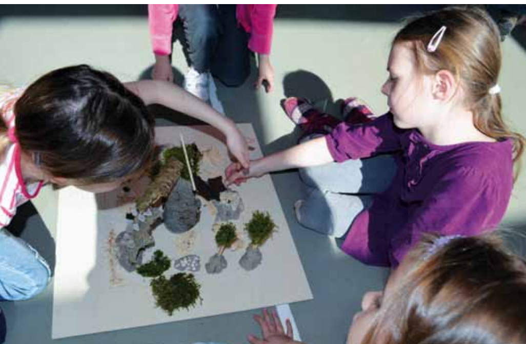
La présentation des idées par les petits «ouvre les cœurs» des politiciens et architectes.