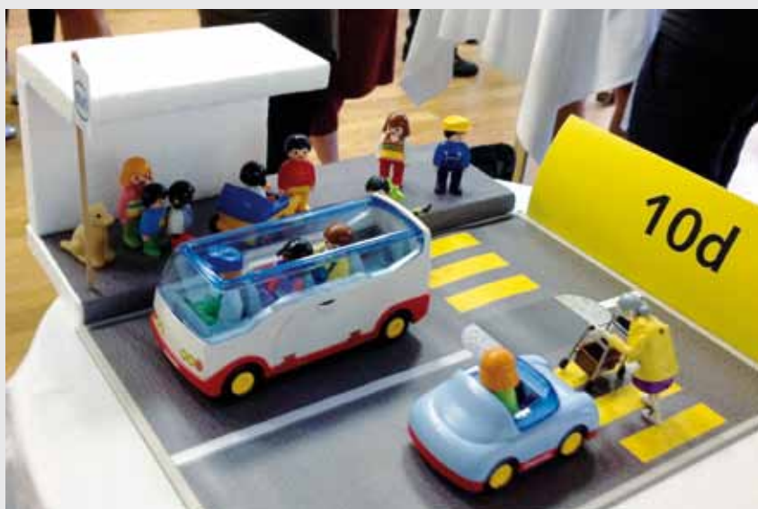
Régler la hauteur de l'engin ou monter sur le trottoir, les participants des cours rollator présentés lors du Speed Dating du 30 juin acquièrent assurance et confort.

Les rollators, ces déambulateurs à quatre roues, permettent à un nombre croissant de seniors de garder une mobilité autonome. Leur nombre dépassera celui des poussettes d'ici 20 ans, estime l'Office fédéral des transports. Or, quelques connaissances de bases sont précieuses pour bénéficier pleinement de l'aide qu'ils peuvent apporter, que ce soit pour monter sur un trottoir ou dans un bus. Pourtant, peu d'utilisateurs sont formés à les utiliser et les efforts consentis pour garantir l'accessibilité des espaces public ne feront pas disparaître tous les obstacles. Pour combler cette lacune, le Büro für Mobilität AG à Berne a développé une offre de cours en collaboration avec des physiothérapeutes et différents partenaires. Sur la base des expériences positives menées dans le canton de Berne, les cours seront prochainement proposés en Suisse romande.