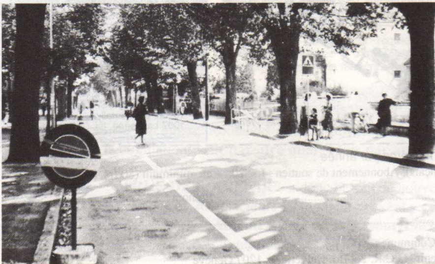
L'avenue de Bel'Air