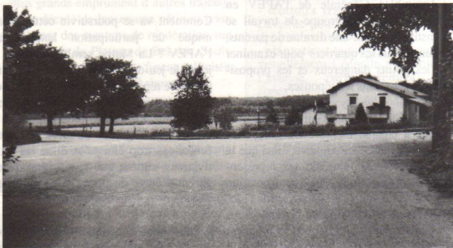
Quelle information glisser dans cet espace pour susciter une conduite responsable ?

Des trois projets présentés dans ce numéro, ceux de Versoix et de Chêne-Bourg se rapprochent de cette version, du moins à leur lancement. Car, par la suite, les initiateurs ont vite pris conscience de la nécessité d'une approche plus