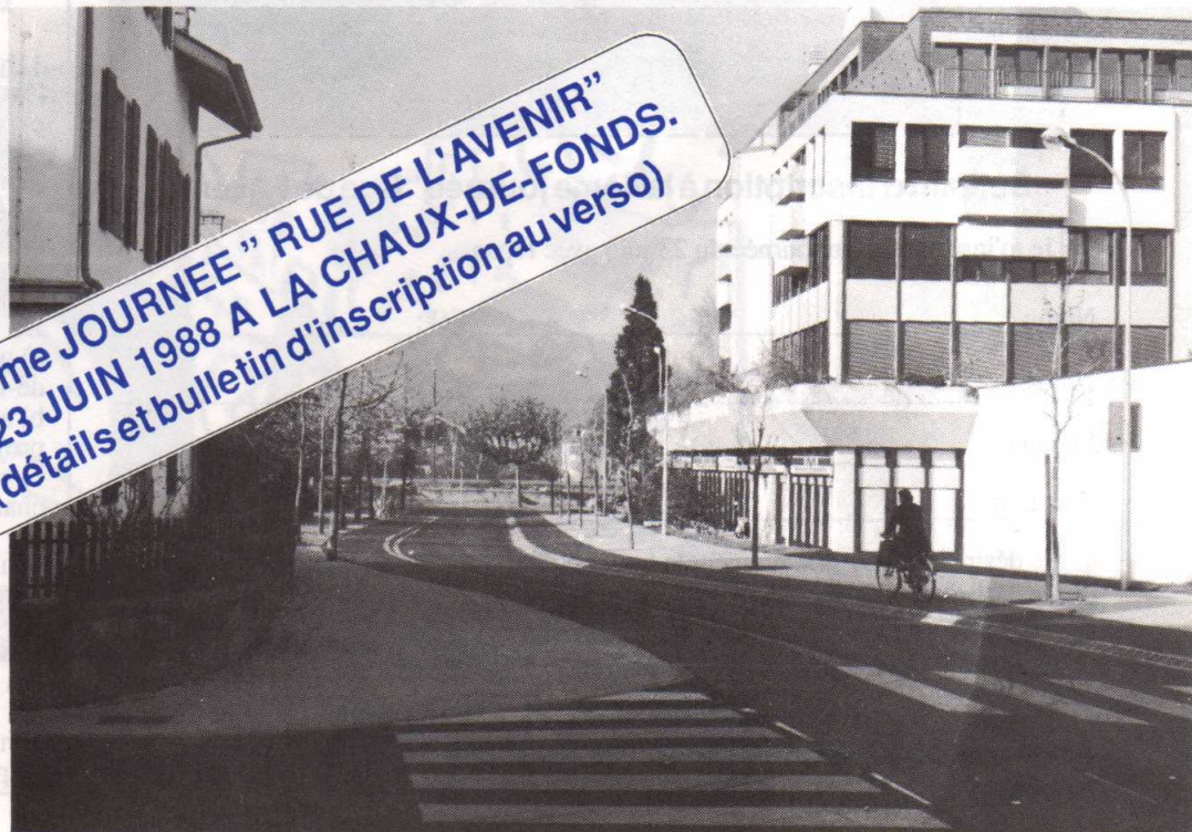
3ème journée "Rue de l'Avenir" à Monthey en juin 87: "le chemin des écoliers"

4ème JOURNÉE "RUE DE L'AVENIR" LE 23 JUIN 1988 A LA CHAUX-DE-FONDS. (détails et bulletin d'inscription au verso)