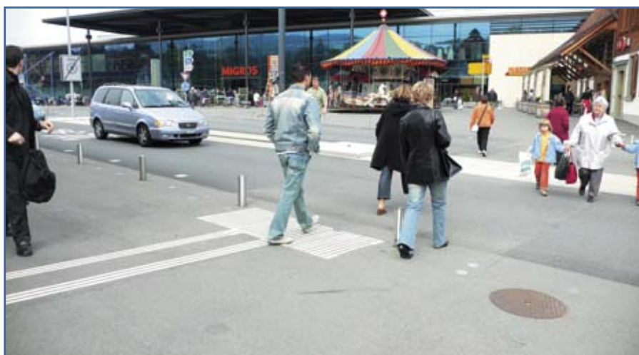
Après: des mesures coordonnées d'aménagement – giratoires aux entrées, bande polyvalente centrale – et d'abaissement de la vitesse (30 km/h) améliorent la situation de tous les usagers: les piétons, mais aussi les automobilistes et les usagers du bus (à vitesse plus lente le trafic est plus fluide et s'écoule plus rapidement).