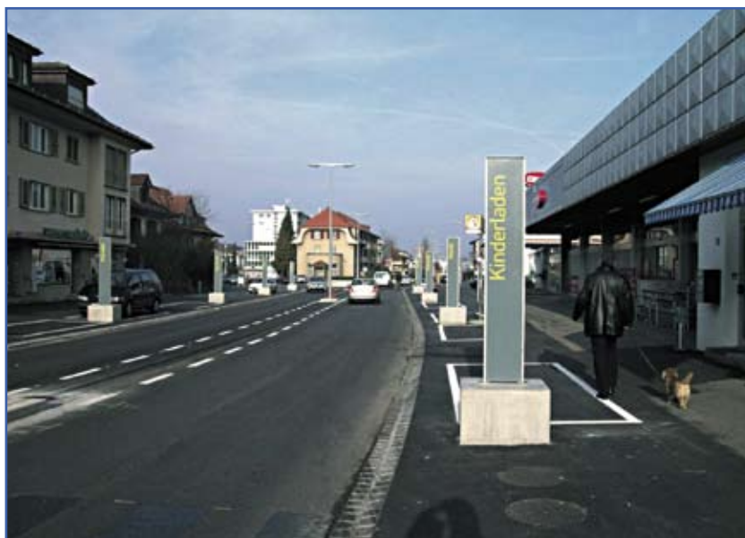
Après: le projet a intégré des considérations concernant la sécurité routière, l'accessibilité aux commerces et l'image de la rue. La vitesse a été abaissée à 30 km/h. Contredisant une idée encore fortement ancrée, le principe «Plus lentement, plus vite au but» profite à tous les usagers et valorise une nouvelle philosophie de la mobilité basée sur la cohabitation.

Afin de garantir la fluidité de la circulation et d'améliorer la qualité de l'air au centre, les carrefours sont réaménagés en giratoires et des signalisations de régulation du trafic sont disposées aux entrées de la localité. Celles-ci, de manière variable selon les heures, ne laissent pénétrer dans le centre que la masse de trafic pouvant être absorbée.