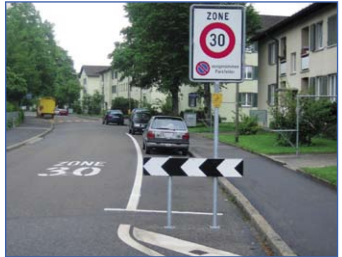
Dans les zones 30, exploiter la marge de manœuvre du «notamment»... (voir ci-dessous). Et – peut-être surtout – faire respecter la vitesse. Par des aménagements, mais aussi par la sensibilisation – et les contrôles.

La table ronde de l'après-midi a permis de revenir dans un premier temps sur les visites du matin, avec quelques compléments d'information qu'il n'était pas possible de montrer en extérieur, puis de donner la parole à des intervenants à la table (représentants de l'Association de parents d'élèves de Genève, du BPA, de l'association Mobilité piétonne) et dans la salle (ville et canton de Genève, participants de France et de Belgique) dans le cours de la discussion générale.