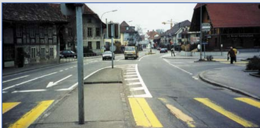
Avant: un espace dévolu essentiellement à la voiture, et des passages piétons contraignants entre lesquels les piétons traversaient de plus en plus.

A ce sujet, il est très intéressant de relever que le tronçon à 30km/h, d'une longueur de 300m, ne leur pose aucun problème. Les études effectuées à la Seftigenstrasse à Wabern (réaménagement similaire) démontrent en effet que la réduction de la vitesse à 30km/h jointe à l'aménagement de giratoires et d'une bande polyvalente centrale n'entraîne pas d'allongement du temps de parcours, et même le réduit. Contredisant une idée encore fortement ancrée, le principe «Plus lentement, plus vite au but» profite à tous les usagers et valorise une nouvelle philosophie de la mobilité basée sur la cohabitation.