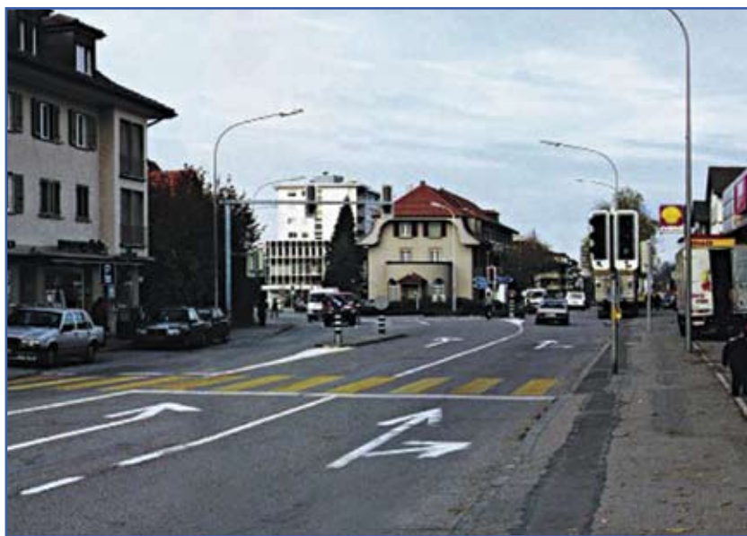
Avant: route principale à 50km/h avec feux et passages piétons

Un centre commercial Coop existe depuis 20 ans aux abords de la rue, Migros inaugure le sien, presque en face, au printemps 2004. Cette implantation a pour corollaire une forte augmentation des flux de piétons se rendant d'un centre à l'autre, ceux-ci pouvant s'élever jusqu'à 700 aux heures de pointe.