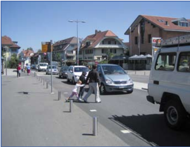
Avec le nouvel aménagement, les piétons et les automobilistes communiquent plus qu'avant. Dans la jungle du trafic, la (re)naissance d'une relation d'être humain à être humain, une utopie réaliste ?