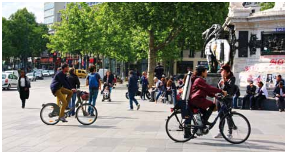
La Place de la République, adoptée par les riverains, est aussi le lieu des grandes manifestations parisiennes et sert de mausolée informel.

Le réseau RUES est un réseau francophone (Belgique, France, Luxembourg, Québec et Suisse) d'experts en mobilité urbaine, conviviale et sûre. Il se réunit chaque année pour échanger les bonnes pratiques dans chaque pays (aménagement, réglementations, gouvernance, communication-sensibilisation...) et visiter une ville ou quelques aménagements exemplaires.