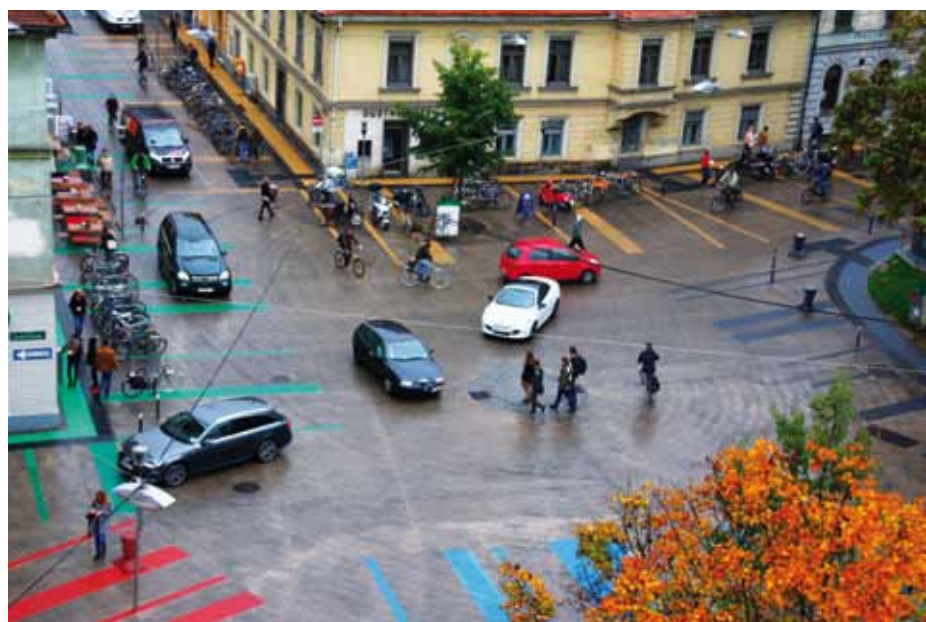
La zone de rencontre de la Sonnenfelsplatz , une expérience réussie de cohabitation dans un environnement sensible.

L'ambition d'une ville partagée est possible et souhaitable. Graz, audacieuse, généreuse, en est la preuve.