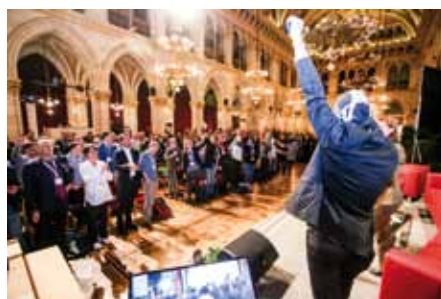
Peatòrito, le justicier mexicain des piétons (voir l'entretien exclusif en page 8) harangue les participants de Walk: Faites la révolution piétonne !

C'est dans la magnifique grande salle de réception de l'Hôtel-de-Ville de Vienne que c'est tenue - du 19 au 23 octobre - Walk21, la grande conférence internationale consacrée aux piétons.