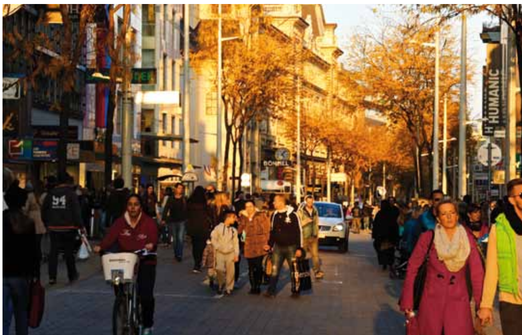
La zone de rencontre commerçante Mariahilfer à Vienne est un succès phénoménal. Longue de 1'800 mètres, avec une courte portion en zone piétonne en son milieu et très bien desservie par les transports publics, la zone de rencontre enregistre près de 70'000 piétons le samedi.

Les trois zones de rencontre emblématiques autrichiennes sont la rue Mariahilfer à Vienne longue de 1,8 km et principale rue commerçante de la ville, la place Sonnenfels à Graz avec 14 000 v/j et la Herrengasse à Linz avec plusieurs lignes de tram. Elles sont détaillées sur notre site.