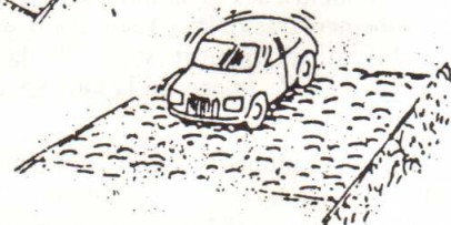
Modification du revêtement