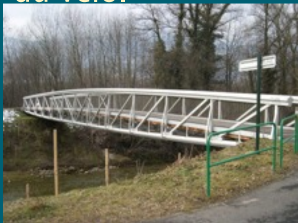
Passerelle Pré Marquis La Motte- Servolex

La priorité est donnée au maillage du réseau cyclable et au raccordement de celui-ci aux Voies Vertes, « colonne vertébrale » du réseau en se référant au schéma de développement des aménagements cyclables et de l'usage du vélo.