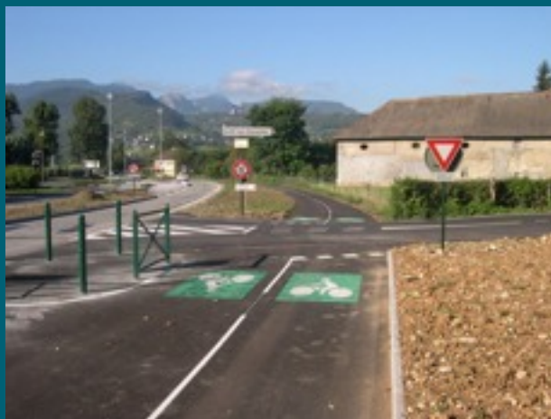
Aménagement sur RD5 La Ravoire