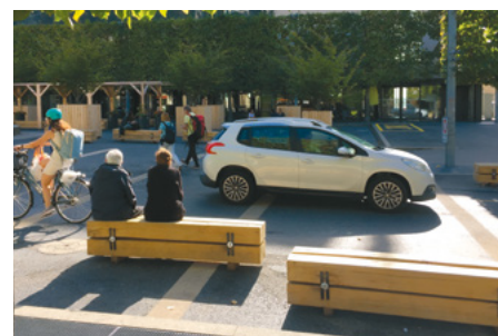
AMÉNAGEMENTS SUR LE PLATEAU DE LA GARE avec zone de rencontre en test pour une année

pérennisation après une phase test lancée en 2019, dans le cadre d'une démarche participative avec les riverains ;