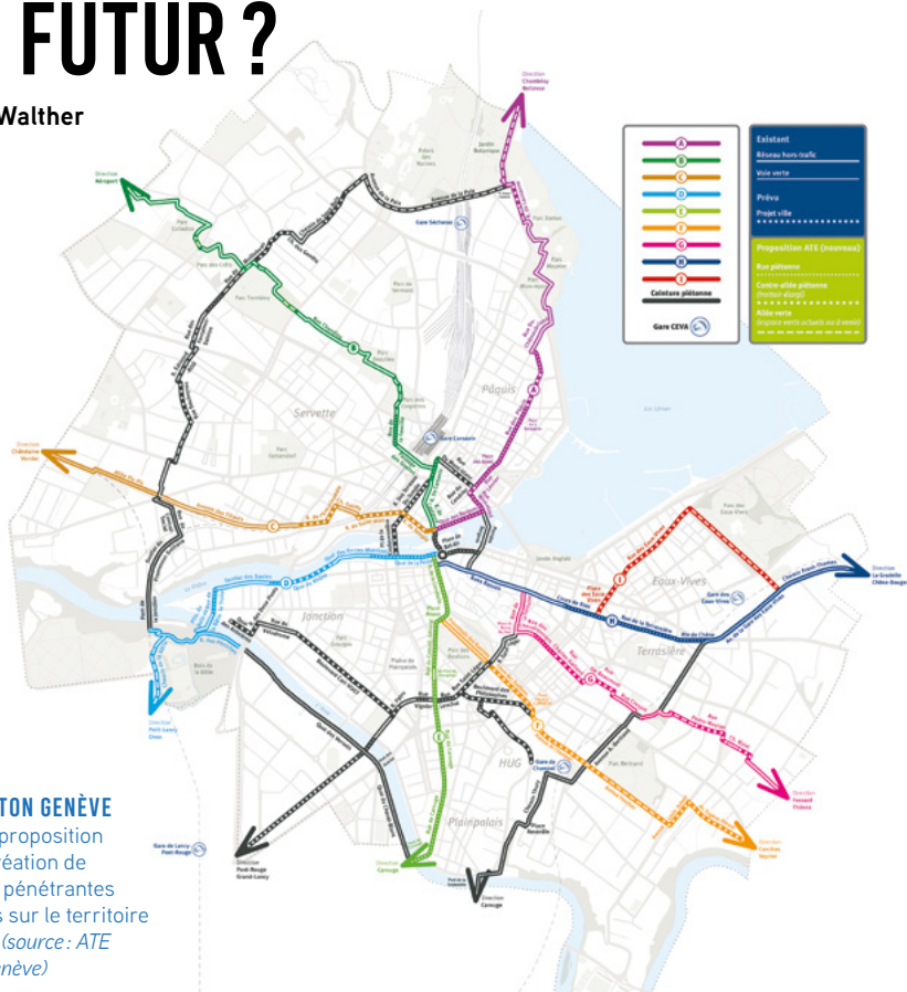
PLAN PIÉTON GENÈVE de l'ATE, proposition pour la création de plusieurs pénétrantes piétonnes sur le territoire genevois

Bien que largement pratiquée, la marche est peu valorisée en tant que moyen de transport. Parent pauvre de la planification et des mesures d'aménagement, elle est trop souvent invisibilisée par d'autres enjeux, dont ceux liés au vélo. L'amalgame entre ces deux modes de déplacement est par ailleurs largement répandu, alors que la marche mérite assurément d'être valorisée pour elle-même.